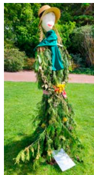
Madame Jardin från 2024.